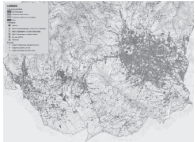
Fig.2 - Aree florovivaistiche della Provincia di Pistoia. Fig.2 - Nurseries areas of the Province of Pistoia.

L'attività vivaistica ornamentale è concentrata nella Valle dell'Ombrone P.se ed interessa oltre 5.200 ettari, con circa 1500 ettari di colture in contenitore, 1500 aziende e oltre 5500 addetti diretti (2500 lavoratori dipendenti) oltre all'indotto, la PLV (Produzione Lorda Vendibile) è di oltre 300 milioni di Euro di cui 160 esportati (Fonte: Progetto economico-territoriale Distretto Rurale Vivaistico-Ornamentale di Pistoia) (fig. 2).