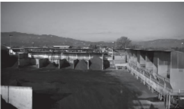
Fig.5 - Impianto per la preparazione dei substrati. Fig.5 - Installation for the preparation of the substrates.

Recentemente si sono aggiunti anche altri prodotti secondari come il biochar che è un carbone vegetale ottenuto per pirolisi di residui colturali, oppure gli stessi residui di patate triturate e parzialmente compostati ed infine anche altri materiali organici secondi come le sanse. E' evidente che la ricerca di nuovi materiali anche differenziati per territorio può costi-