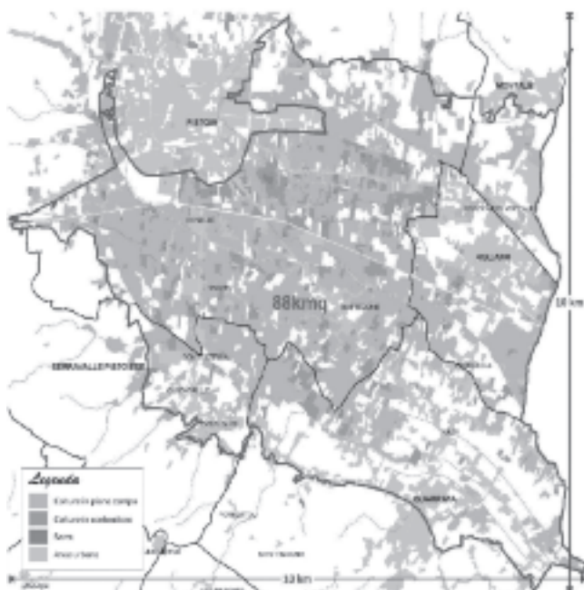
Fig.4 - Ripartizione colture sul territorio pistoiense. Fig.4 - Breakdown crops on the territory of Pistoia.