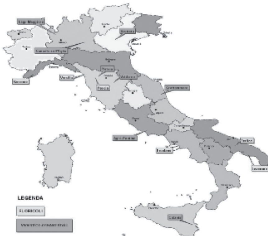
Fig.1 - I Distretti del florovivaismo in Italia. Fig.1 - Districts floriculture in Italy.

Gli investimenti, nonostante le difficoltà ad attivare gli aiuti comunitari, sono tuttora rilevanti in specie nel campo delle tecnologie meccaniche e dell'impiantistica irrigua, come dell'adeguamento dei fabbricati per la lavorazione e lo stoccaggio delle piante.