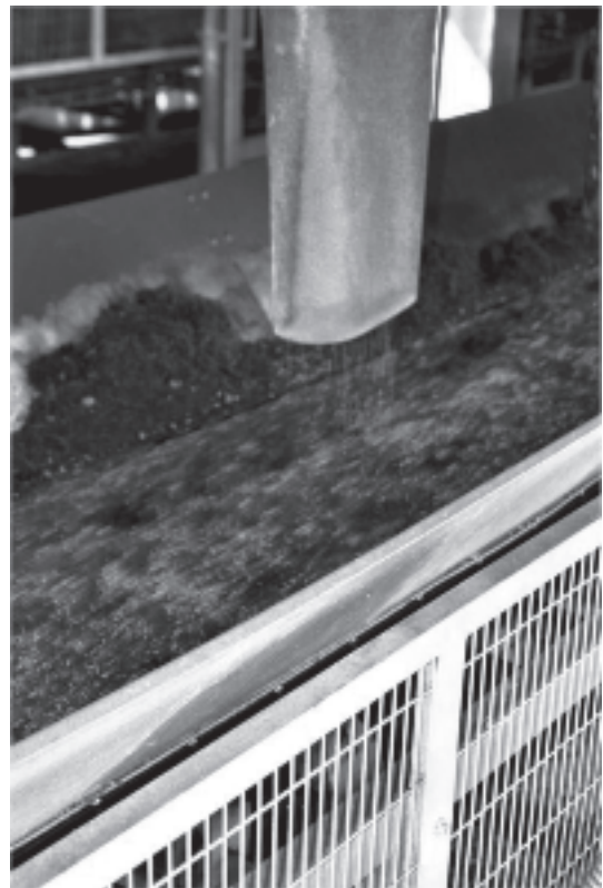
Fig.6 - Aggiunta automatizzata di fertilizzanti al substrato. Fig.6 - Automated addition of fertilizers to the substrate.

La sostenibilità della coltivazione in contenitore sul piano ambientale è evidentemente legata alla pos-