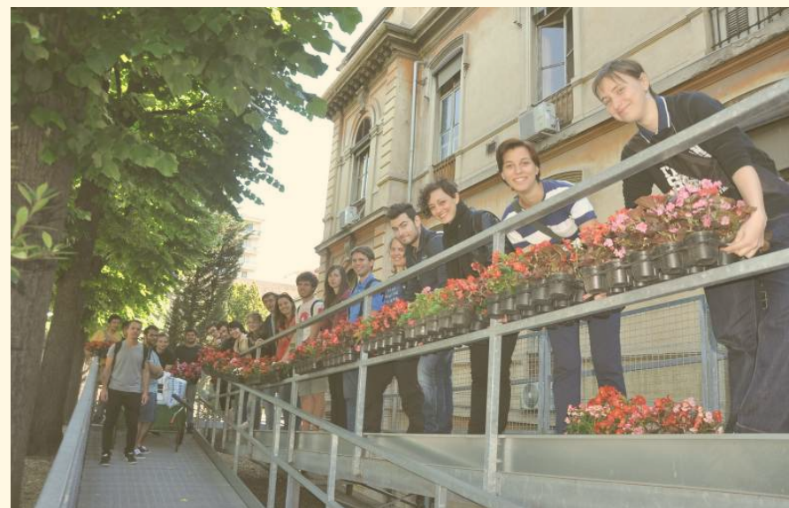
Messa a dimora di fiori nei corridoi dell'Ospedale Mauriziano di Torino da parte degli studenti del DISAFA.

Gli healing gardens sono da molti anni una realtà concreta in diversi Paesi e stanno acquisendo sempre più importanza nelle nostre città, nei nostri ospedali, nelle nostre residenze degli anziani anche in Piemonte .