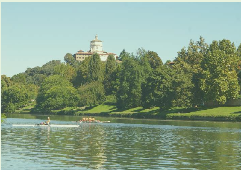
Il verde della città di Torino lungo le sponde urbane del Po ampiamente fruito dalla cittadinanza.

Le aree verdi incidono sulla qualità della nostra vita ed il Covid-19 ha palesato in modo ancora più evidente la necessità di verde da parte dei cittadini. Un settore particolarmente fragile è da sempre quello sanitario e la pandemia ha ancora di più evidenziato che condizioni equilibrate da un punto di vista psicofisico sono importanti non soltanto per i pazienti, ma anche per le persone anziane e per gli operatori sanitari.